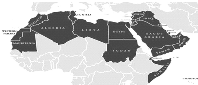
Figura 1: Mundo árabe

O mundo árabe (em árabe: ‘ālam al-‘arabī ) é visto como uma nação árabe (em árabe: al-ummah al-‘arabīyyah ) constituída por vinte e dois países que integram a Liga Árabe (figura 1). O árabe é língua (co-)nacional e (co-)oficial dos países que contituem o mundo árabe.